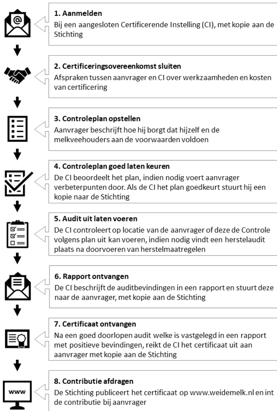
Figuur 2: Stappenplan voor certificering

In Figuur 2 staat schematisch uitgelegd welke stappen een bedrijf moeten doorlopen voordat er een Certificaat Weidegang uitgereikt kan worden.