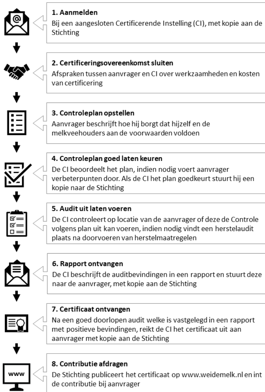
Figuur 2: Stappenplan voor certificering

In Figuur 2 staat schematisch uitgelegd welke stappen een bedrijf moeten doorlopen voordat er een Certificaat Weidegang uitgereikt kan worden.